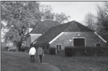
Zwolle valt reuze mee