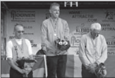
NK snelwandelen in Tilburg