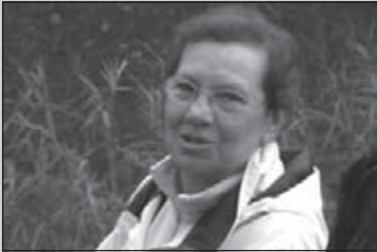
De OLAT 'felicitatiedienst'

CLUBBLAD VAN WSV OLAT • JAARGANG 34 • NUMMER 12 • DECEMBER 2008